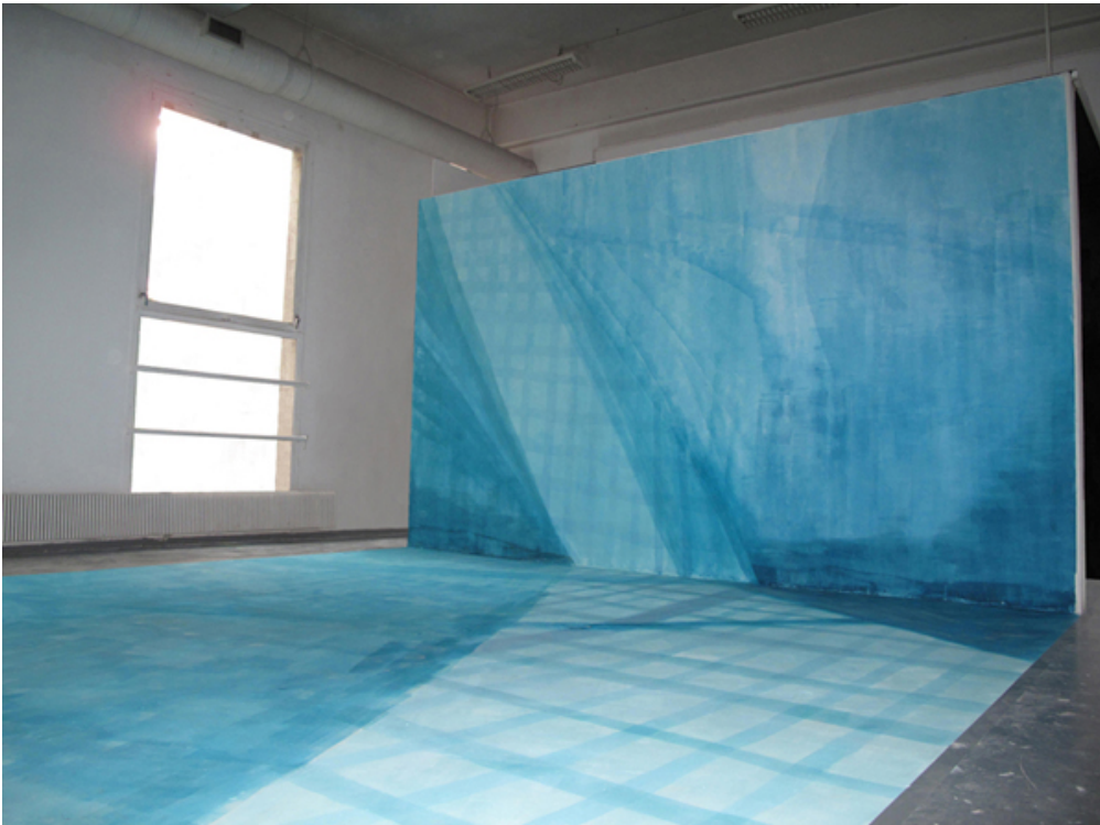
LA PISCINE, 2009, Peinture et pigment à même le mur, Dimensions variables - in situ

« Je ne suis pas particulièrement portée par la peinture contemporaine, je m'ennuie un peu du châssis, baille de la peinture, crois - bêtement - qu'en terme d'images, on a assez donné. Et puis j'ai parcouru (physiquement) le travail de Flora Moscovici, acrylique et tempera tout en finesse et en économie de moyens, d'une grande sensibilité, un travail in situ toujours en accord parfait avec l'espace. Alors, paradoxalement, sa peinture a ôté les couches qui engluaient l'endroit pour m'en révéler la trame, l'essence. Comme si Flora dédoublait le lieu, le déplaçait pour revenir à une unité primitive. »